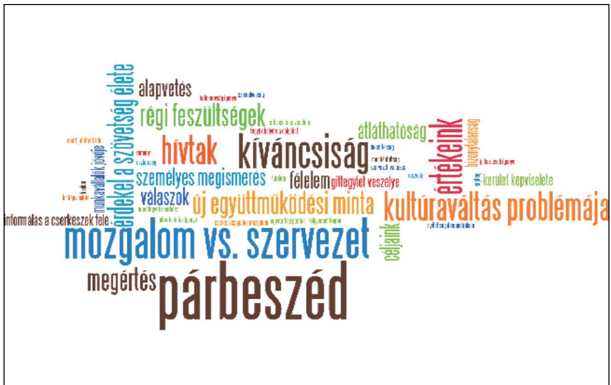
2. ábra: részvételi motivációk

Az első alkalommal a jelenlévők motivációit térképeztük fel. A folyamat során mindenki elmondta, hogy miért kapcsolódik be a munkacsoport munkájába, miért tartja fontosnak a részvételt. Az elhangzottakat a szófelhő módszerével dolgoztuk fel: